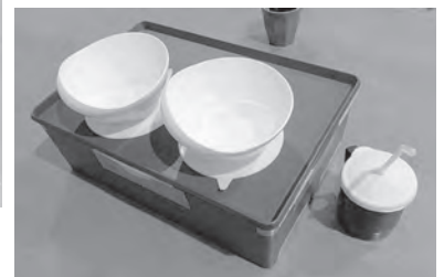
食事がこぼれにくい食器と食事台▼

こうした環境整備をすることで、食事が食べやすくなり、自分で食べることが身体機能・生活能力を維持していくことにつながります。日々の生活が生活リハビリとなり、主体的な生活が意欲を高め、将来の選択肢が増えていく。障害が重度でも、高齢で身体機能が落ちても施設でしか生活できないと考えるのではなく、『当たり前働き、選べる暮らし』の実現を多職種連携で取り組んでいます。