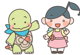
ゆたか福祉会キャラクター ゆたかめくんとみらいちゃん