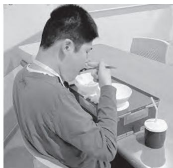
▲自然に最適な食事姿勢が取れるようになりました