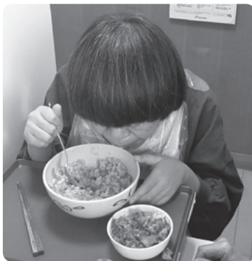
▲座席配置に配慮して補助台を使い食事をするBさん

刺激が減り、食事介助を行う職員とコミュニケーションをとりながらの食事が可能となりました。また口に溜め込むことが減り、食事時間も短くなり、本人も落ち着いて食事を楽しむことが出来るようになりました。