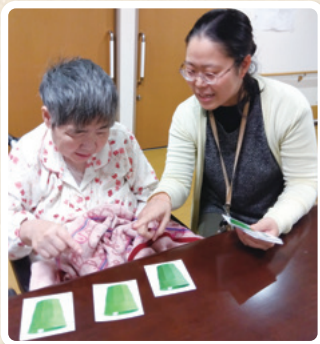
絵カードを使いながら、 水分量の確認

高齢化や障害の重度化で食べられ なくなる仲間が増えてきました。最 後まで「食事」を楽しめるよう、多 職種連携の一員として、今後も食と 健康の分野で仲間を支えていきたい と思います。