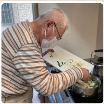
ホームで食事作り