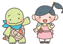
ゆたか福祉会キャラクター ゆたかめくんとみらいちゃん