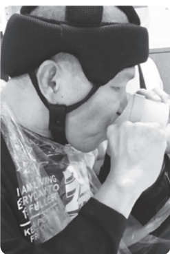
▲レボUコップを使用しているAさん

・刻んだ食材をトロミ餡でまとめ、口の中で本来作られる食塊に近い状態にして飲み込みやすくしました。 ・口の中や喉に残っている食物がスムーズに飲み込めるように食事の合間にお茶を促す声掛けをしました。 ・レボUコップという介護食器(写真参照)を提案しました。