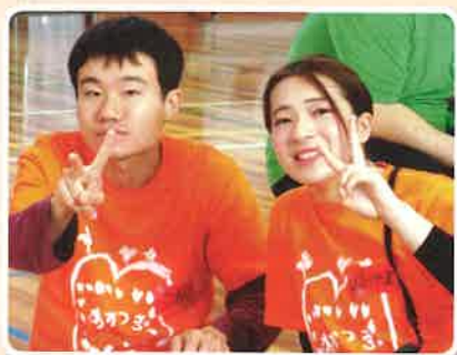
楽しんでます！ (2019年度3施設合同運動会)

バケット生地を使った新商品の開発に取り組んでいます。試作を始めた頃は失敗も多く、なかなかうまく進みませんでした。失敗も仲間たちと共有し、「なぜダメだったのか」について話し合いを行うことで、少しずつ問題を解決してきました。試作が上手くできた時には全員で喜び、その仲間たちの姿を見るのも好きな瞬間です。 何も正解のないスタート地点から、仲間と一緒に新しいことを進める機会は、とても貴重だと思えます。試行錯誤しながらも楽しんで、仲間たちと販売に向けて取り組んでいけたらいいなと思っています。