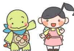
ゆたか福祉会キャラクター ゆたかめくとみらいちゃん