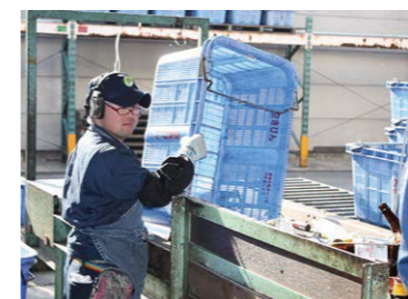
空き瓶・空き缶 選別リサイクル(名古屋市委託) リサイクル港作業所