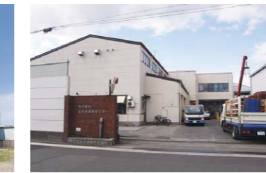
リサイクル港作業所(港区) 就労継続支援B型