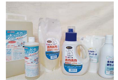
肌にやさしい石けんや 重曹製品 つゆはし作業所