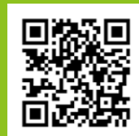
ゆたか福祉会のおゆみ

現在では、障害分野の地域福祉を担う拠点として、相談支援事業やヘルパー派遣事業などをはじめ、就労と生活を支える総合的な事業体となっています。2008年からは高齢分野のデイサービスやグループホームなどの事業も行っています。