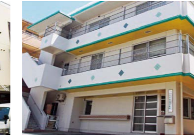
みのり共同作業所(南区) 生活介護