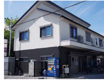
トライズ(南区) 就労継続支援A型・B型