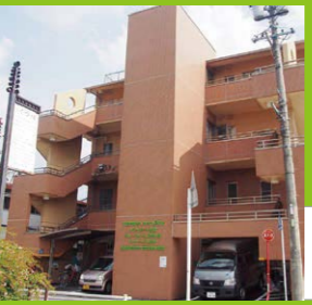
E グループホーム宝南の家 デイサービス宝南 ケアサポート宝南