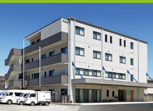
G 法人本部 ゆたか作業所 ライフサポートゆたか ゆたか相談支援事業所どうとく