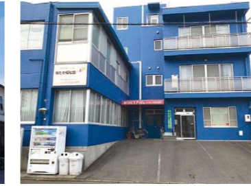
ふれあい共同作業所(南区) 生活介護