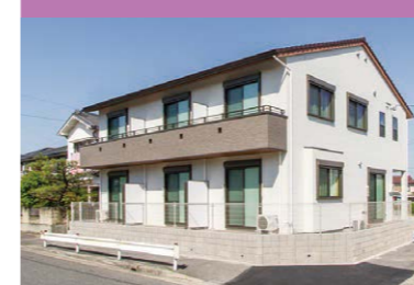
高齢障害者用のグループホーム

バリアフリーで、お風呂・トイレなど介護を想定した設備を準備。廊下も広く、エレベーターも設置しています。