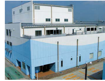
リサイクルみなみ作業所(南区) 就労継続支援B型