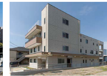
みらいる(港区) (3F:ホームみらい) 生活介護