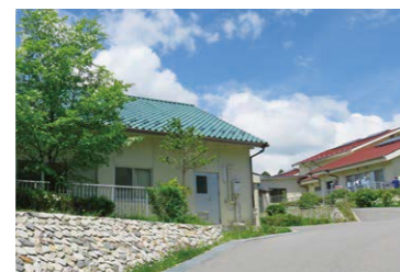
第2ゆたか希望の家

1980年ゆたか福祉会最初の生活施設として、名古屋市緑区で開設。日中は4つの班に分かれて、労働や療育を中心とした活動をしています。全室個室ユニット制で、24時間365日、医療スタッフと協力し、常に必要な医療が受けられるように機敏な対応をしています。直営厨房でバランスよく季節感があり、体に良いゆたかな食生活の保証に努めています。