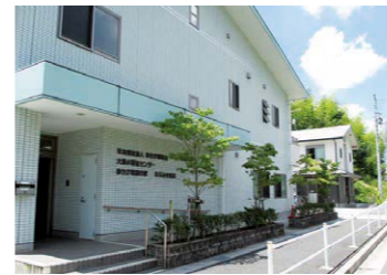
なるみ作業所(緑区) 就労継続支援B型・生活介護