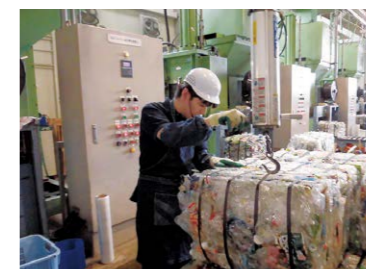
ペットボトル・牛乳パック 選別リサイクル(名古屋市委託) リサイクルみなみ作業所