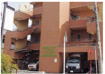
デイサービス宝南(南区) 共生型生活介護