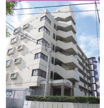
マンションの一部を借りて運営しているグループホーム