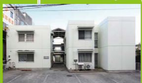
N なるみ作業所 ゆたか希望の家