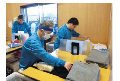
病院や施設などの衣類洗濯 トライズ