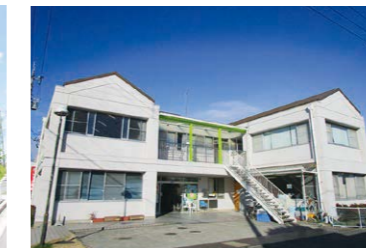
あかつき共同作業所(北名古屋市) 生活介護