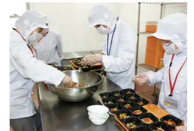
フックチル製法による 給食食材加工 ゆたか作業所