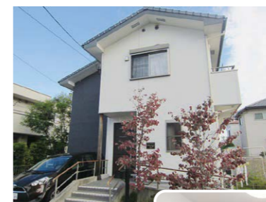
一戸建住宅型のグループホーム