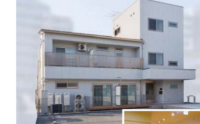
身体障害者の利用ができるグループホーム

バリアフリーで機械浴も設置。廊下も広く、2階の5部屋は各居室にお風呂・トイレ、ミニキッチンが完備されています。