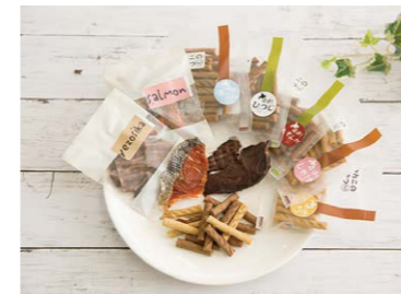
無添加のペットフード ふれあい共同作業所