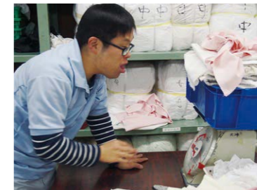
工場の油拭き用ウエス みのり共同作業所