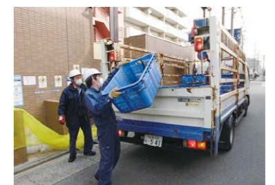
空き瓶・空き缶定期回収 (名古屋市委託) トライズ