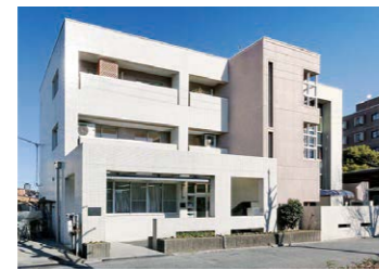
つゆはし作業所(中川区) 就労継続支援B型・生活介護