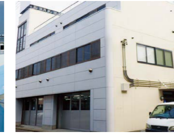
ワークセンターフレンズ星崎(南区) 就労移行・就労B型・生活介護