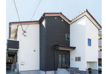
強度行動障害の方も利用できるグループホーム

知的障害の重い方や強度行動障害の方も利用しているホームです。壁や床など設備面の配慮とともに、スタッフの専門性も強化しています。