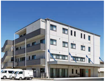
ゆたか作業所(南区) 就労継続支援B型・生活介護