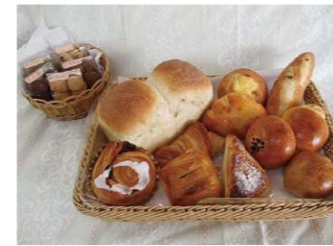
全粒粉を使用した手作りクッキー 国産小麦と天然酵母のこだわりのパン あかつき共同作業所

ゆたか福祉会では、事業所ごとに様々な商品やサービスを提供しています。 スタッフと障害のある方々が一生懸命作業することで生み出された手作りの商品や心温まるサービスを紹介します。