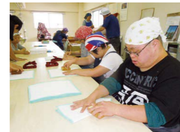
台所用カヤフキン ゆたか作業所 つゆはし作業所