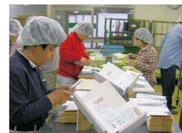
メール便の封入作業 ワークセンターフレンズ星崎