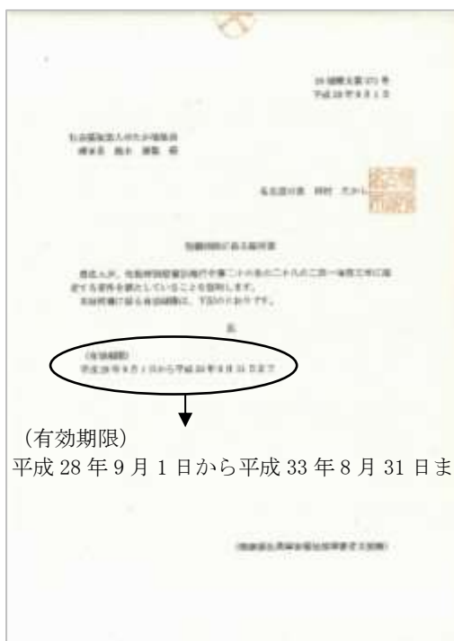
2021年8月31日までの領収書用

2021年9月1日寄附分より「税額控除に係る証明書」が変更になっています。2021年8月31日までの領収書と9月1日以降の領収書の両方がある方は、確定申告をされる際には2種類の「税額控除に係る証明書」の添付が必要になります。